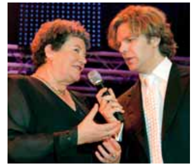
Dagmar Schipanski mit Sportmoderator Michael Steinbrecher