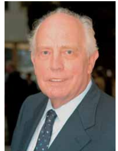
Schrieb in der BamS: INSM-Kuratoriumsvorsitzender Hans Tietmeyer

Hamburg – Reformen zurücknehmen oder weitertreiben, damit mehr Chancen für alle möglich werden, Mindestlohn ja oder nein – vor dem Hintergrund solcher Fragen rief Bild am Sonntag (7. Oktober) Prominente zur öffentlichen Debatte auf. Auch Hans Tietmeyer antwortete auf die BamS-Frage „Wann ist ein Land sozial gerecht?“