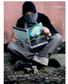
Anzeige zum Buch.

Weitere Kooperationspartner bei diesem Projekt von Initiative Neue Soziale Marktwirtschaft (INSM) und ICC Deutschland sind die Zeitschriften Geldidee und Wertpapier des Heinrich-Bauer-Verlags. „Globalisierung verstehen“ gibt es am Kiosk und im Buchhandel.