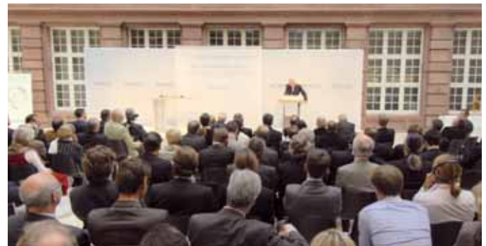
Rund 300 Zuschauer verfolgten die VI. Ludwig-Erhard-Lecture der INSM mit Professor Edmund S. Phelps.

Prägung. Zitat: „Viele Beobachter glauben immer noch, dass hinter dem Begriff „Soziale Marktwirtschaft“ ein kapitalistisches System steckt, das durch ein Wohlfahrtssystem mit einer sozialen Grundsicherung und sozialen Hilfsprogrammen ergänzt wird. Dabei hat der Kapitalismus Sozialversicherungsprogramme nie generell ausgeschlossen.“