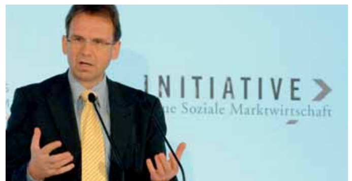
Thüringens Ministerpräsident Dieter Althaus stellte sein Modell des Bürgergeldes vor.