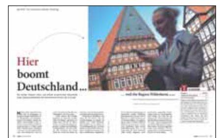
Das INSM-Gründerranking als Aufmacher im Magazin impulse.

„Hier boomt Deutschland ...“, so überschrieb das Magazin impulse, Medienpartner der Initiative Neue Soziale Marktwirtschaft (INSM), seinen Bericht über das Gründer-Ranking. Zitat: