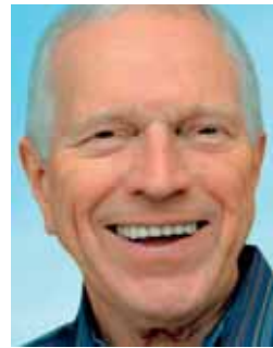
Edmund S. Phelps