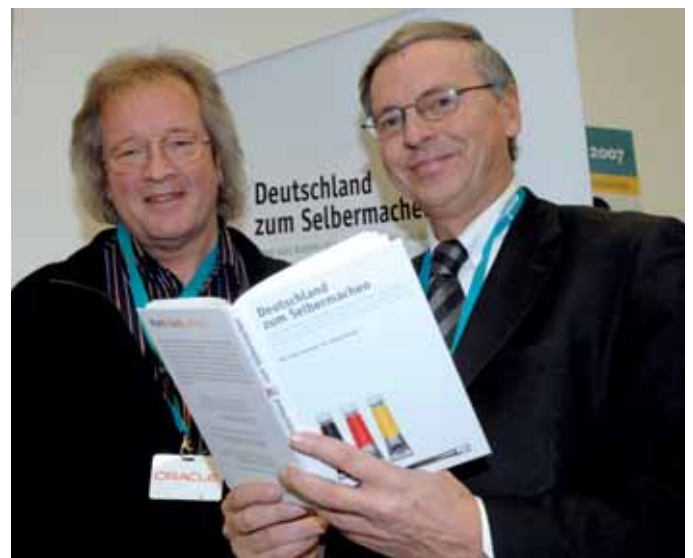
Unions-Fraktions-Vize Wolfgang Bosbach als amüsiertes Leser des INSM-Buches „Deutschland zum Selbermachen“