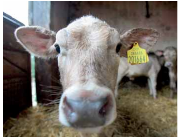
Rindvieh-Gesetz: Eine Verordnung über Ohrmarken musste wieder korrigiert werden, weil die Platzierung der Marke am Kuh-Ohr falsch angegeben war.

„(Rinder): Anforderungen nach dem Anhang der Entscheidung der Kommission 84/247 EWG vom 27. April 1984 zur Festlegung der Kriterien für die Anerkennung von Züchtereinigungen und Zuchtorganisationen, die Zuchtbücher für reinrassige Zuchtrinder halten oder ein-