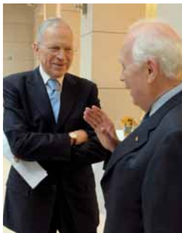
INSM-Kuratoriums-vorsitzender Hans Tietmeyer im Gespräch mit Edmund S. Phelps.

In seiner Begrüßung hatte der INSM-Kuratoriums-vorsitzende Hans Tietmeyer an ein zur Rede von Phelps passendes Zitat von Ludwig Erhard erinnert: „Eine freiheitliche Wirtschaftsordnung kann auf Dauer nur dann bestehen, wenn und solange auch im sozialen Leben der Nation ein Höchstmaß an Freiheit, an privater Initiative und Selbstvorsorge gewährleistet ist.“