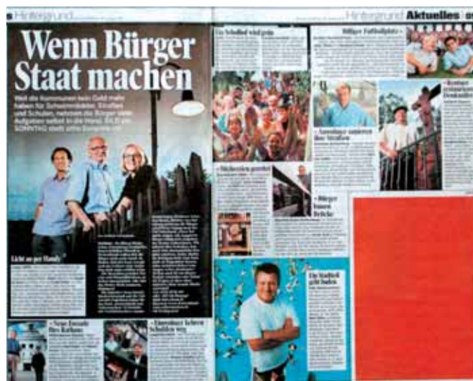
Bild am Sonntag präsentierte zehn Beispiele aus dem INSM-Buch auf einer Doppelseite

Unter der Schlagzeile „Wenn Bürger Staat machen“ stellte die Bild am Sonntag zehn Beispiele aus „Deutschland zum Selbermachen“ vor.